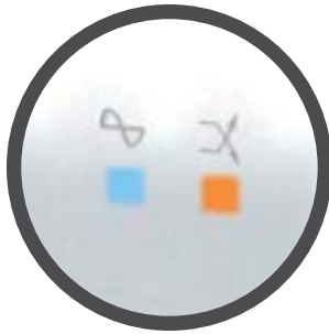
Pantalla LED oculta.

El nuevo y avanzado Regulador de Voltaje Automático R2C-AVR1004ia, el más completo y de mejor calidad. Este nuevo producto ofrece 4 tomas de salidas, corrige bajas y altas tensiones y proporciona un regulado de 220 VCA.