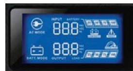
Panel de control y monitoreo LCD Nivel de carga/Nivel de Baterías Voltaje de entrada y salida/Frecuencia de salida Temperatura del equipo