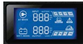
Panel de control y monitoreo LCD Nivel de carga/Nivel de Baterías Voltaje de entrada y salida/Frecuencia de salida Temperatura del equipo